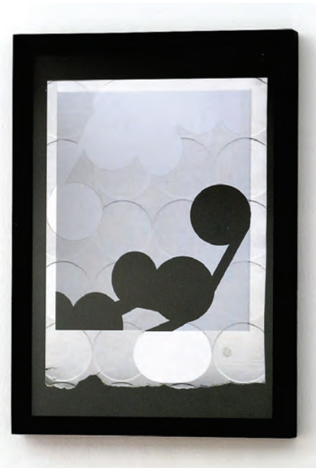
Luca Trevisani, Untitled, 2006 Mixed media on paper, 40 x 30 cm Collection Palmieri, Savona

Light is essential for understanding space, and space is essential for building up collective actions. Anyone who believes they can use formal expressions to deal with social interests will inevitably turn to architecture.